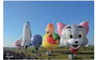
佐賀国際バルーンフェスタ